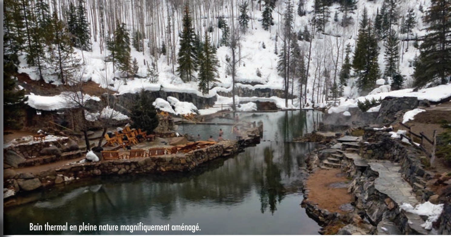
Bain thermal en pleine nature magnifiquement aménagé.