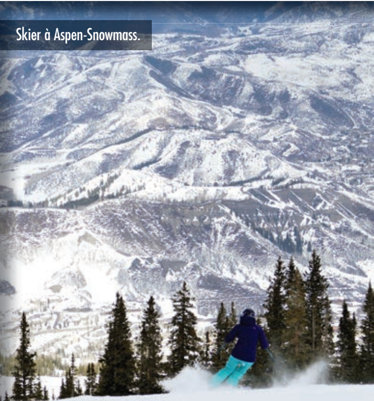
Skier à Aspen-Snowmass.