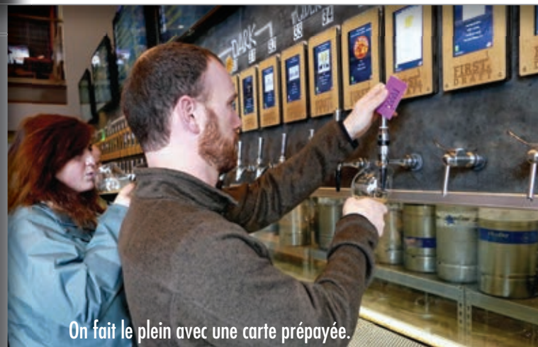
On fait le plein avec une carte prépayée.