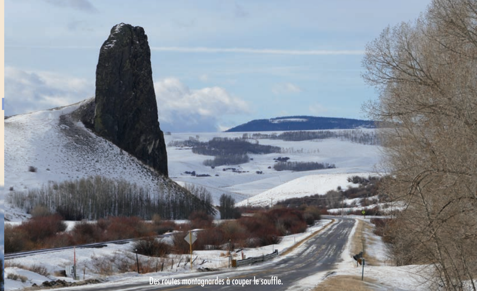
Des routes montagnardes à couper le souffle.

C'est maintenant devenu une tradition. Chaque année, la première destination touristique que nous vous faisons découvrir se trouve à l'extérieur du Québec. Et, cette année, nous n'avons pas lésiné sur la distance ni sur l'originalité de l'endroit en nous rendant au Colorado.