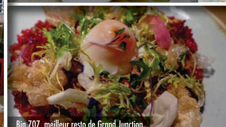
Bin 707, meilleur resto de Grand Junction.