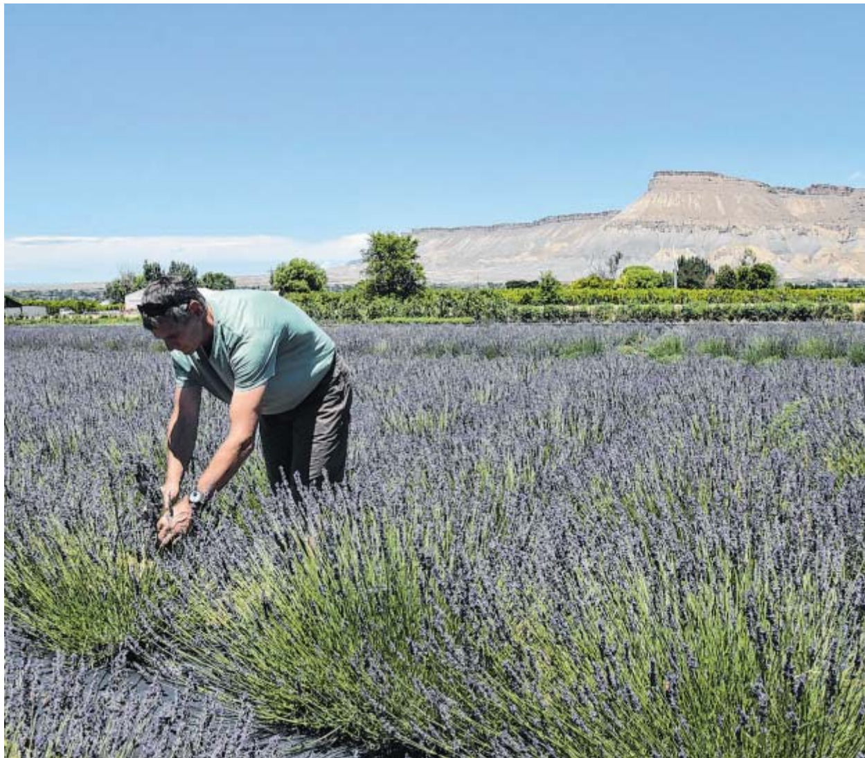
Nicht nur Gemüse: Der Lavendel wird zu Seifen, Lotionen und Ölen weiterverarbeitet.